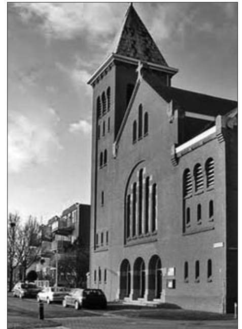
De Oud-Katholieke kerk in IJmuiden.

Ook de selectie van 33 transcripties van akten of delen daarvan – variërend uit de jaren tussen 1290 en 1450 – uit dit zeer oude 13 e -, 14 e -, 15 e - en 16 e -eeuwse archief, deze winter door de werkgroep gemaakt, zal dit najaar op de website van het Genootschap te bekijken zijn: www.hgmk.nl