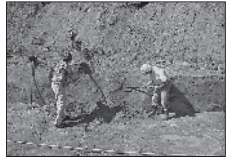
De opgraving tegenover het gemeentehuis van Heemskerk aan de Mozartstraat/Marquettelaan

Het Kennemer College organiseert ieder jaar een fietstocht voor de derdeklassers door Heemskerk en Beverwijk waarbij op belangrijke punten mensen van de beide historische verenigingen staan om uitleg te geven over markante objecten in de omgeving. De werkgroep werd door de HKH uitgenodigd om ter plekke een uitleg te geven over het archeologisch monument Oud-Haerlem. De reacties van de leerlingen waren, ondanks het zeer slechte weer,