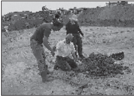
De opgraving van Waldijk II te Uitgeest

met gebruikssporen, slijtsporen, brandsporen enz. De gemeente Beverwijk heeft royaal gefaciliteerd.