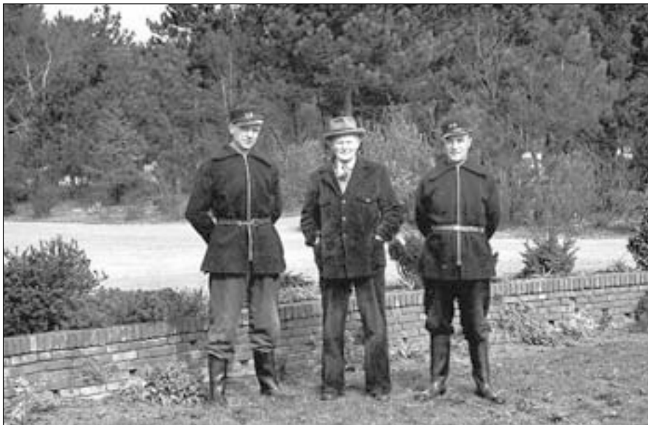
Foto personeel Alg. Begraafplaats Duinrust, 1953

Naar oud christelijke gebruik was het begraven in de kerk in zwang gekomen. In het begin was dit voorrecht enkel en alleen aan de adel en geestelijken voorbehouden. Maar later eist de gegoede burgerij dit recht ook op. Ook toen gold wie het meeste geld of aanzien had, kreeg de beste plek. Waarbij het hoogkoor in de kerk de meest geliefde plek was, daar deze altijd op het oosten gericht was, de locatie waar de zon opkomt. Het middenkoor, voor iedere kerkganger goed zichtbaar, was een goede tweede. De