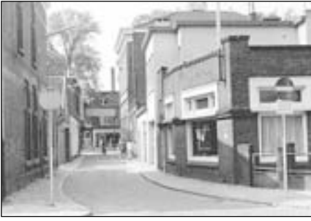
Door de Raadhuisstraat kijken we richting Breestraat en zien daarachter de schoorsteen van wasserij 'De Lelie' boven de huizen uitsteken.