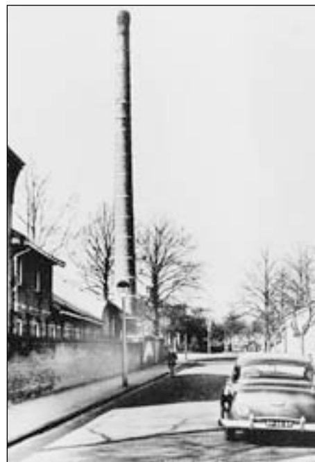
De pijp van Docter, de naam die ook zo in deze schoorsteen was aangebracht. Hij is in 1957 gesloopt.

Links de schoorsteen van de Beverwijkse Conservenfabriek uit 1918. Rechts de fabriek met zijn mooie achtkantige schoorsteen uit 1934.