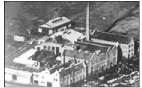
De visverwerking van de Chemische fabriek 'Noord-Holland'.

De formele naam van de vismeelfabriek was Chemische Fabriek 'Noord-Holland'. Als laatste in die rij langs de Pijpkade stond de Cacaofabriek 'Land en Zee'; ook deze fabriek had een schoorsteen.