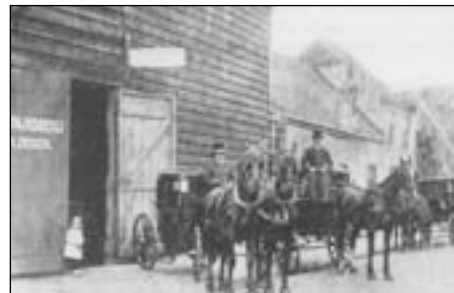
Stalhouderij Dekker in de Wilhelminastraat

Tot oktober 1950 blijft het begraven per koets door de firma Dekker in Beverwijk bestaan. De eerste lijkkoets wordt in november verkocht. Daarna wordt de vraag langzamerhand minder.