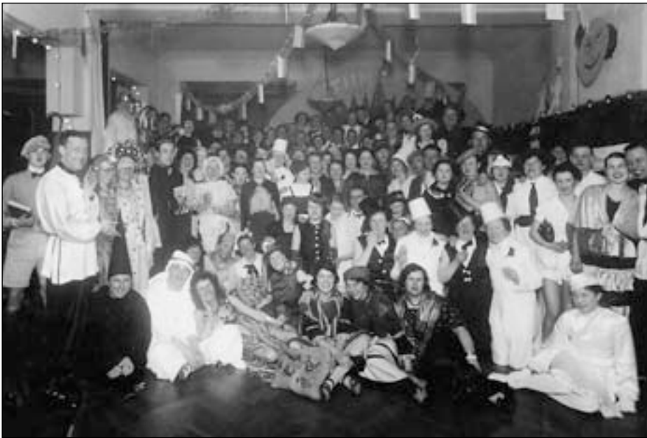
Bal Masqué, 1937