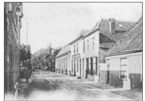
Maison Stroucken in de Zeestraat