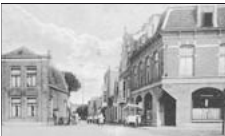
Zeestraat 21, waar Kindergeluk repeteerde boven het Blauwe Café.

De leiding was jarenlang in handen van A. Hofland, maar werd in 1928 overgenomen door Gerrit Berghuis, die zelf kindertoneelstukken schreef! Ook broer Bertus met zijn vrouw Lies de Greef werden actief