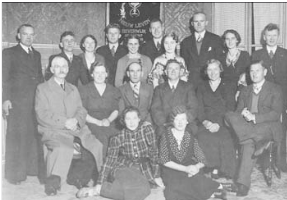
Nieuw Leven in 1936