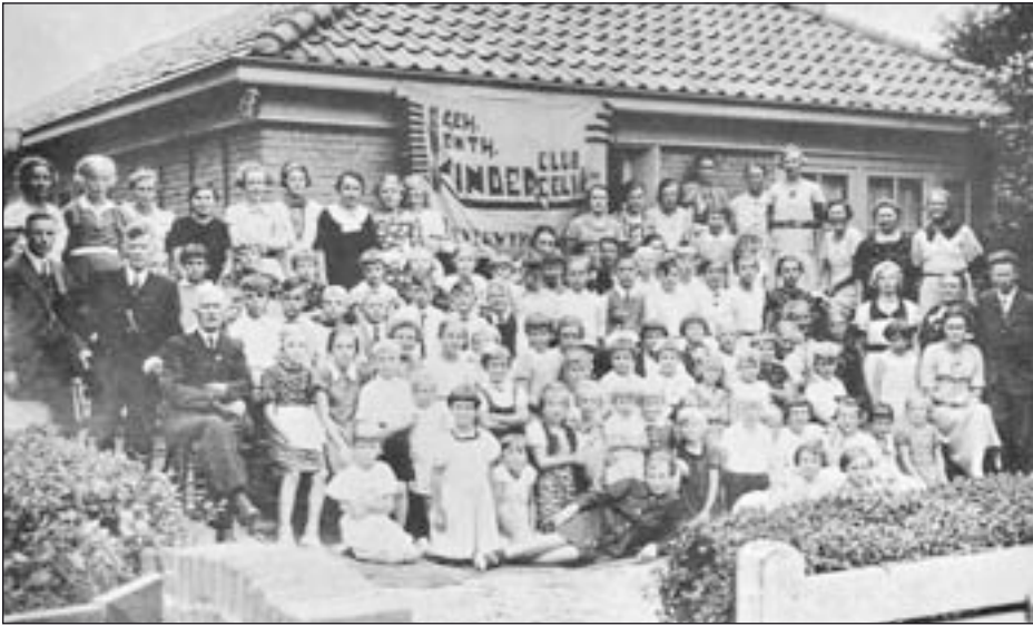
Kindergeluk in 1936 voor het Harmoniegebouwtje aan de Groenelaan