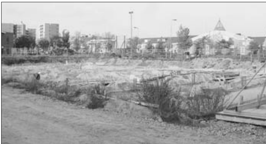
Een overzicht van het opgravingsterrein aan de Jan Ligthartstraat.

os werd gedraaid. Voor de werkgroep was dit een bijzondere verrassing. Overal in de regio zijn prehistorische akkerlagen aangetroffen, maar door de kleinschaligheid van bouw en/of het onderzoek was het oppervlak nooit groot genoeg om dit aan te kunnen treffen. In één van de wanden van de bouwput werd een groot aantal aardewerkfragmenten aangetroffen die door het baksel, zeer hard en waarschijnlijk met zand verschaald, behoren tot een waarschijnlijk moeilijk te dateren en nog onbekende aardewerkgroep. Tijdens de aanleg van de liftschaft en verdere diepgaande werkzaamheden van de uitvoerder werden bij toeval afdrucken van mens en dier aangetroffen, alsmede, op grote diepte, de zogenaamde "strandribbels" die ontstaan bij eb en vloed aan de kustlijn. Deze zijn schoongeschaapt en direct gefotografeerd voordat de voortgang van de werkzaamheden en de kwetsbaarheid van het dunne kleilaagje waarin deze stonden dit onmogelijk zou maken. Deze bijzondere ontdekking en de noodwaarnemingen van de werkgroep hebben veel