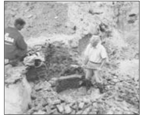
Deze waterput, gefundeerd op een wagenwiel zonder spaken, kon gelukkig net voor het vernietigen, of leeggroeven door derden, vlug onderzocht worden.