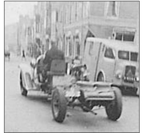
Het chassis van de Buick in 1947

Eind jaren vijftig werd in het bedrijf weer een nieuwe, complete ambulance aangeschaft: een antraciet-keurige Packard. De burgerij vond deze maar niks en "niet mooi" tegenover die witte Ford, maar hij "gleed" (zoefde) fantastisch en dat maakte veel goed. Hierna kocht Jan Beliën nog een Chevrolet aan, die hij zelf van binnen helemaal ombouwde: brancard, kastjes, verbandkisten enz. Zijn vrouw naaide de gordijntjes tegen de ongewenste inktijk.