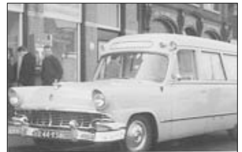
De witte Ford van de gemeente in 1957