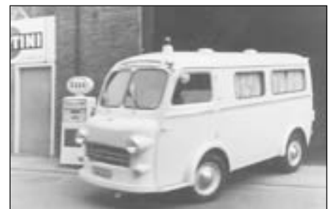
De Peugeot: het hobbelpaard.