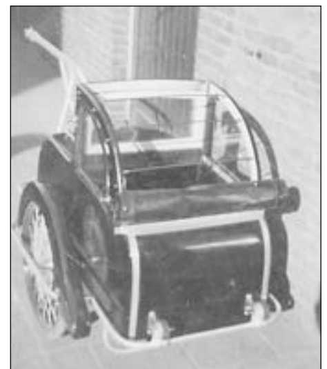
Het karretje voor de baby

Wél werd hem het beschikbare bedrag van f200,- toegekend, zijnde zijn deel en het deel van de Gebr.Oosterom. Vóór de oorlog was al een onderstel van een Buick aangekocht, waarop een nieuwe ziekenwagen zou worden gebouwd. Deze werd pas na 1948 verder gemonteerd, bedoeld als vervanging van de eerste Paige.