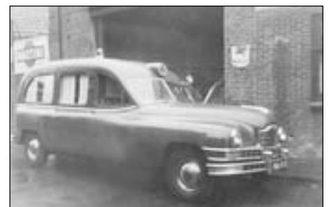
De Packard, omstreeks 1960