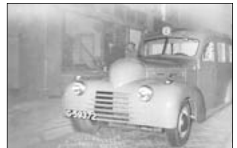
Het resultaat van de Buick in 1948