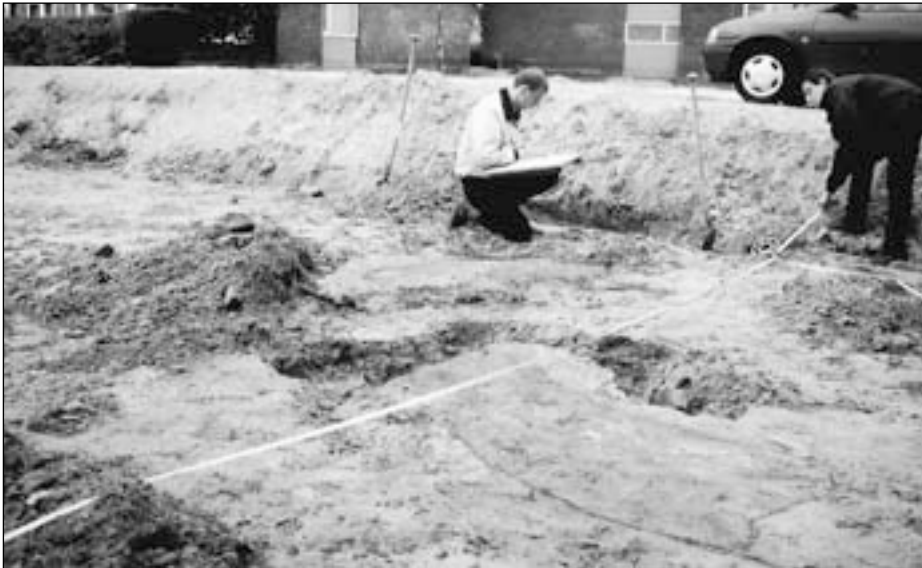
Leden van de werkgroep anno 2000, bezig in een bouwput om de sporen vast te leggen van het verleden.

De tentoonstelling zal op 23 november a.s. worden geopend.