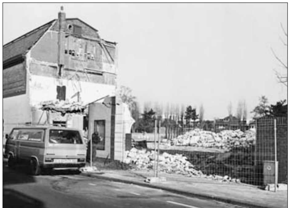
februari 1986

manifestaties, beheerd door de Stichting Theater. Deze moest zelfs \pm 20 weekends per jaar bestemmen voor eigen uitvoeringen. Dit bleek toch niet geheel te voldoen, zodat later de ruimten voor alle activiteiten opengesteld werden, zelfs de horeca.