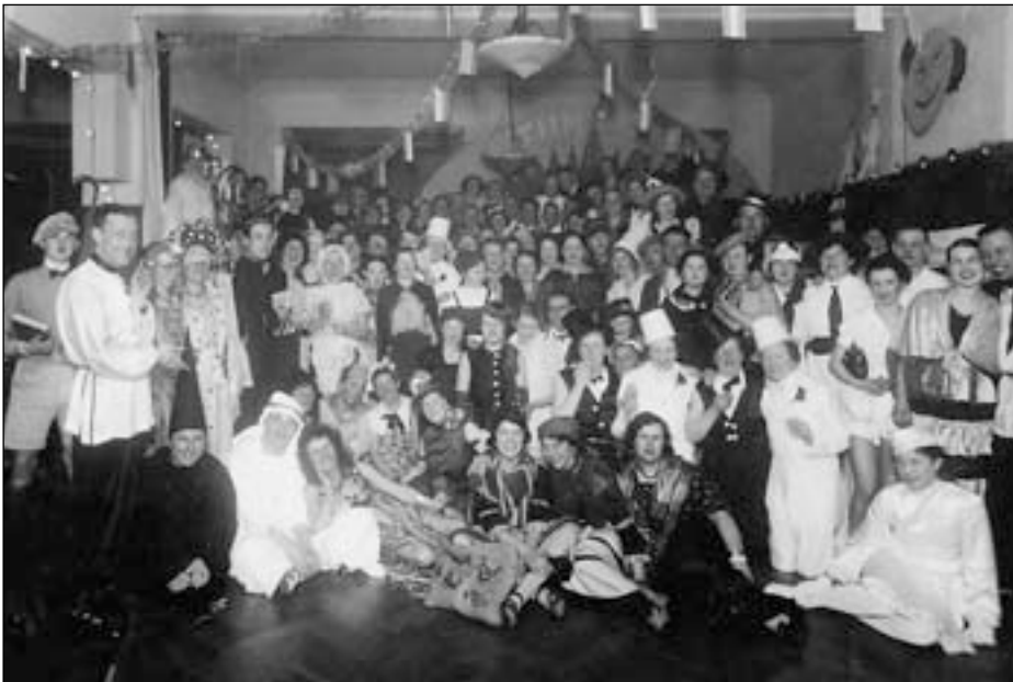
Bal Masqué, 1937