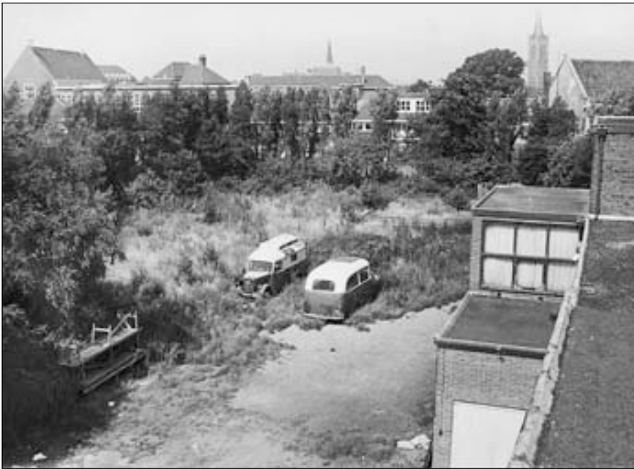
Het braakliggend terrein achter het Kennemer Theater

halen door dit "onzalige" plan. Hiermee was het lot van de K.S.A. bezegeld.