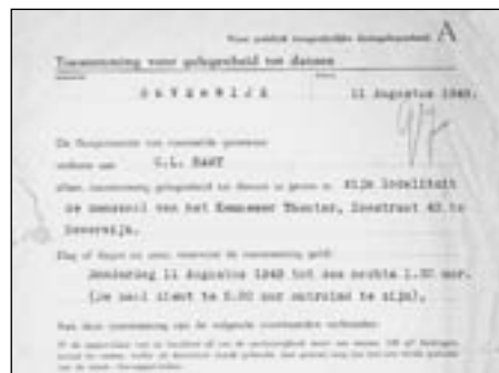
Dansen tot sluitingstijd...