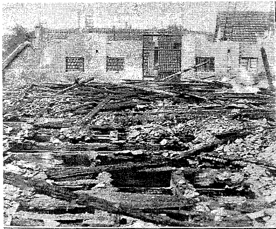
Dit was over van het pakhuis van de firma Bos & Co na de brand.