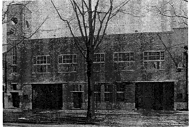
Op de plaats waar vroeger hotel "de Zon" stond is later het veilinggebouw "Kernemerland" neergezet.