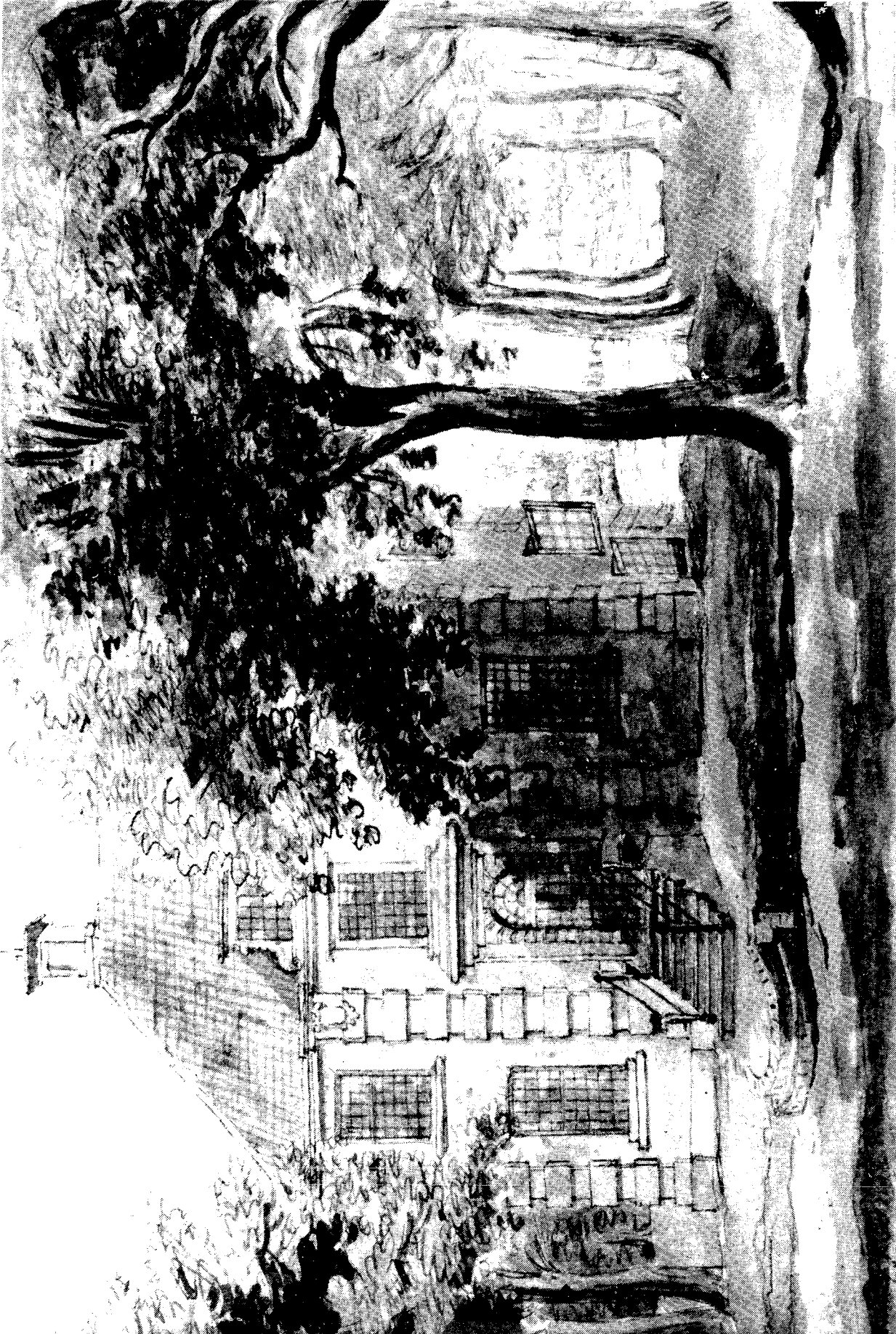
Aquarel van het in 1737 gebouwde "grote huis" Rooswijk.

In 1799 getekend door J.P. Taunay, zoon van de eigenaar Jan Frederik Tauney.