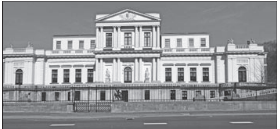
Paviljoen Welgelegen is ook tijdens de Open Monumentendagen te bezoeken.

In 2005 is begonnen met het ontwerp voor de restauratie. Het pand wordt na de restauratie sinds januari 2009 weer door het bestuur van de Provincie bewoond en de opgave was vooral om