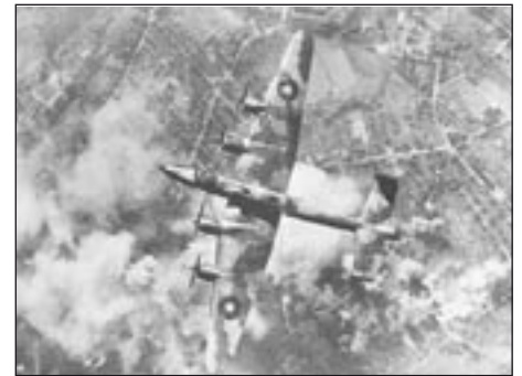
Een Handley-Page Halifax

Gezien het feit echter dat het lichaam van de korporaal al op 6 april 1945 is aangetroffen is dit niet mogelijk. Bovendien wordt er volgens de RAF geen bemanningslid vermist uit dit toestel. Het lijkt daarom uitgesloten dat de korporaal uit dit toestel afkomstig kan zijn geweest.