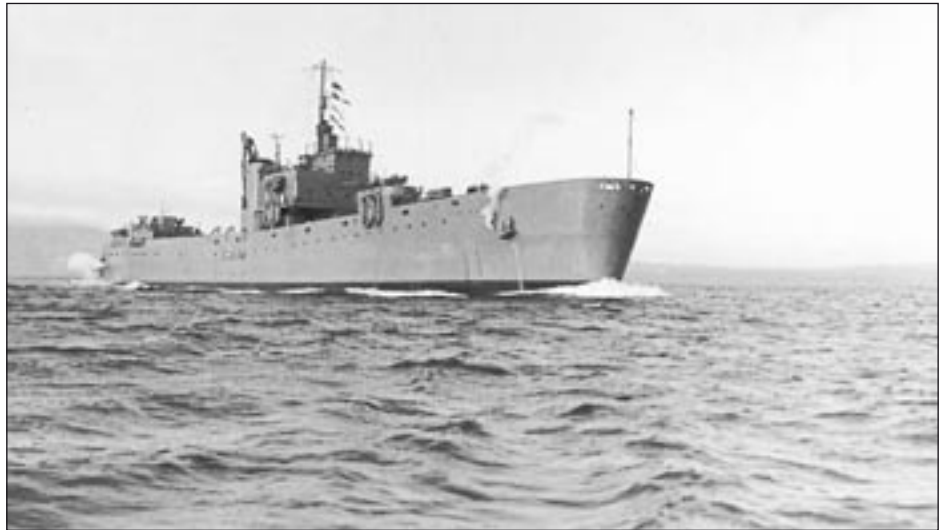
Een LST, gefotografeerd in 1943

Bouwjaar/werf: 6 November 1942 Bethlehem Fairfield, Baltimore USA.