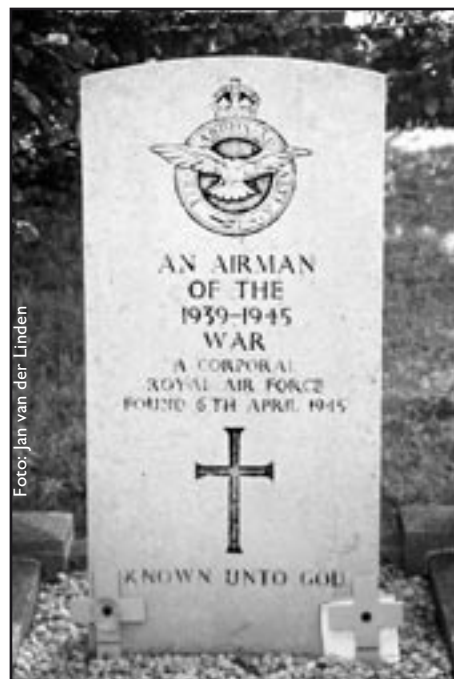
(1) Vrij vertaald, "Bekend bij God" (R. Kipling) Standaard aangebracht op de graven van ongeïdentificeerde Gemenebest militairen uit de beide wereldoorlogen.

Het lichaam is omstreeks 6 april 1945 aangetroffen op het strand bij Velsen ter hoogte van strandpaal 54 doch pas op 13 april geborgen op last van de Ortscommandant (3) . Het lichaam is onderzocht door de plaatselijke politieman Ypma in het bijzijn van zijn zoon. Het slachtoffer is vervolgens op 14 april omstreeks 18.00 begraven op de begraafplaats van de Ned. Hervormde Kerk te Wijk aan Zee in bijzijn van de zoon van dhr. Ypma. Vanwege het feit dat de pont tussen Ijmuiden en Velsen