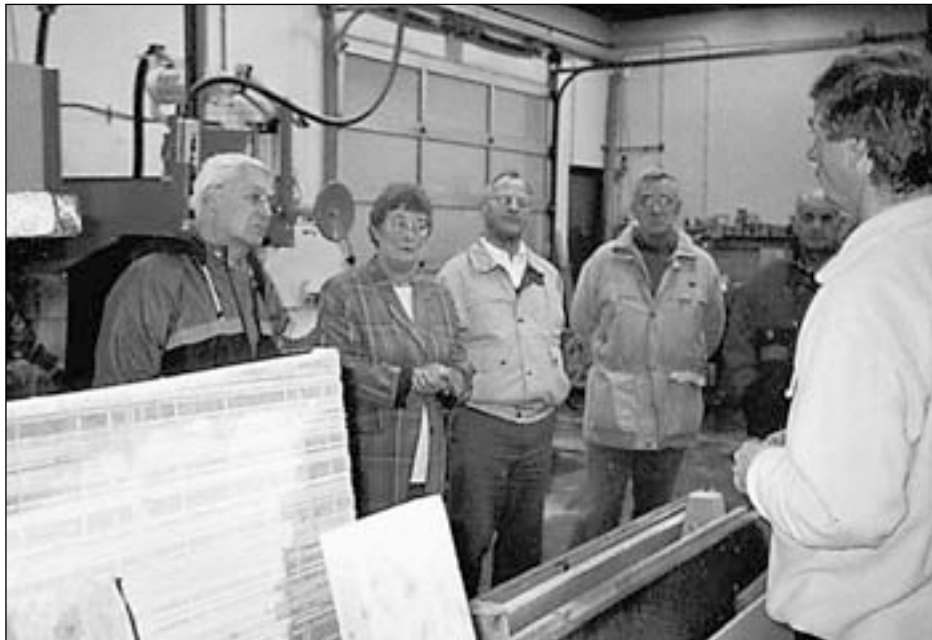
leden van de werkgroep Duinrust op bezoek bij de firma Groot

juiste steen soort: zandsteen, hardsteen, marmer of graniet? Terrazzo, cementsteen of terracotta? Voor dit doel werd er een excursie georganiseerd naar de steenhouwerij Groot, tegenwoordig gevestigd op het industrieterrein. Speciaal voor de werkgroep opende op een zaterdagmorgen in april de directeur zijn deuren en daarna gaf hij ons een boeiende uitleg over zijn bedrijf. Vol verbazing liepen wij rond in de grote hal met de enorme zaagmachines, de opslagplaats met de lange platen van gesteenten, de apparaten voor het polijsten, de techniek voor het beitelen van de opschriften. Begonnen als een familiebedrijf in grafstenen aan de Munnikenweg bleek de productie nu voor een groot gedeelte bestemd te zijn voor industriële doeleinden: keukens, badkamers, gevels en vloertegels. Maar de speciale showroom voor de grafmonumenten gaf ons een goed inzicht in de moderne vormgeving en het gebruik van steensoorten.