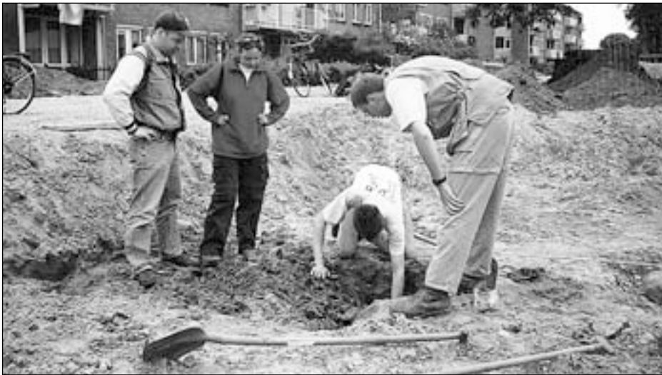
Opgravingswerkzaamheden nabij het Europaplein

Kennemers. Op het L-vormig terrein werden bij herbepanting aan de oppervlakte enige scherven proto-steengoed en grijs aardewerk aangetroffen en enige steenmassa's aangeprikt. In de gracht werd bij een slootuitgang een dammetje opgeworpen voor nader onderzoek. Dit bracht op twee en een halve meter van de huidige buitenwand van de gracht een beschoeiing aan het licht die nog te zien is op een 17e eeuwse prent. Ook werden er veel plavuís-, baksteen-, daktegel- en aardewerkrestanten aangetroffen, teruglopend tot in de 15e eeuw. Ook vonden we enig slachtafval. In de toekomst zal hier nog een vervolgonderzoek plaatsvinden om een eventuele band met het hoofdterrein van het voormalige slot Adrichem te kunnen aantonen.